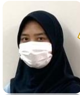
インドネシア出身

I.C.NAGOYA で勉強したことは本当に役に立つと思います。アルバイト先だけではなく、子どもの学校の先生とのコミュニケーションもよく取れるようになりました。また子どもの学習のサポートもできるし、母国語でも日本語でもコミュニケーションが取れるので、子どもが日本とベトナムの言語や文化が身につけられるのがうれしいです。