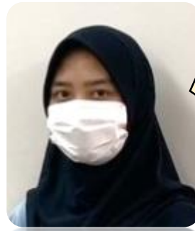
インドネシア出身

I.C.NAGOYA で勉強したことは本当に役に立つと思います。アルバイト先だけではなく、子どもの学校の先生とのコミュニケーションもよく取れるようになりました。また子どもの学習のサポートもできるし、母国語でも日本語でもコミュニケーションが取れるので、子どもが日本とベトナムの言語や文化が身につけられるのがうれしいです。